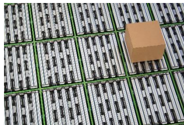
Abbildung 2 Der GridSorter im Einsatz: https://youtu.be/Avt2QMOFw0M

Geboten wird eine spannende und abwechslungsreiche Arbeit, in der eigene Vorschläge und Ideen ausdrücklich gewünscht sind. Darüber hinaus bietet die Arbeit reale Einblicke in die Geschäftsprozesse des Unternehmens flexlog. Weiterführende Arbeiten in dem Themengebiet sowie in Kooperation mit flexlog sind denkbar.